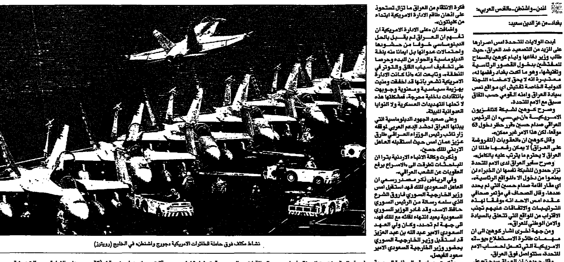
تشات مكلف فريق حملة الطائرات الأمريكية بجورج واشنطن في الخليج